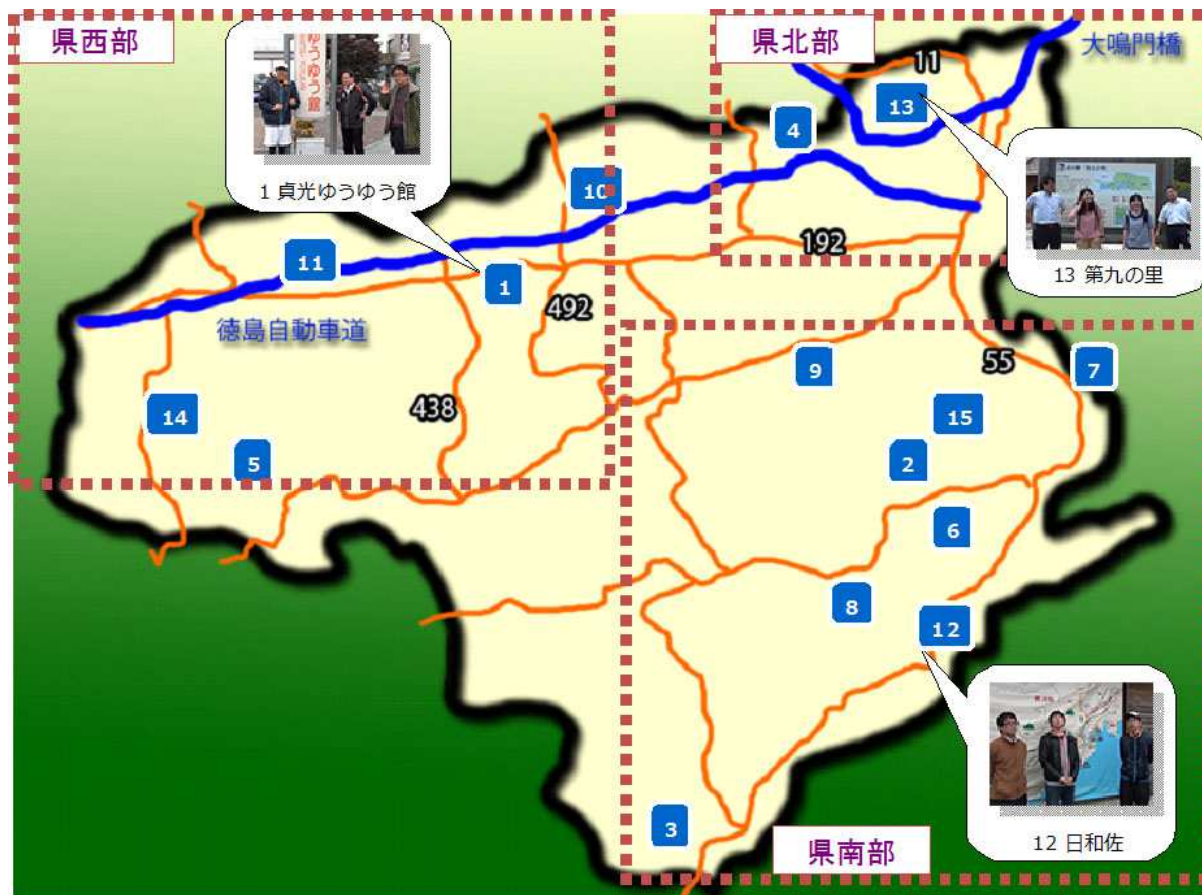
図 3.1 3 分割されたロケ地の概要

徳島県を県北部，県西部，および県南部の 3 地域に分割し，それぞれの地域ごとに道の駅を拠点とした周辺情報を収録する．図 3.1 に記載された番号は，徳島県内にある 15 カ所の道の駅を国土交通省の登録順に番号付したものである．国土交通省四国地方整備局が提供する四国の「道の駅」マップ ( http://www.skr.mlit.go.jp/road/rstation/eki.html ) より引用している．本事業では，県北部にある 13 番「第九の里」，県西部にある 1 番「貞光ゆうゆう館」，および県南部にある 12 番「日和佐」を拠点に周辺の観光スポットの体験映像を収録した．