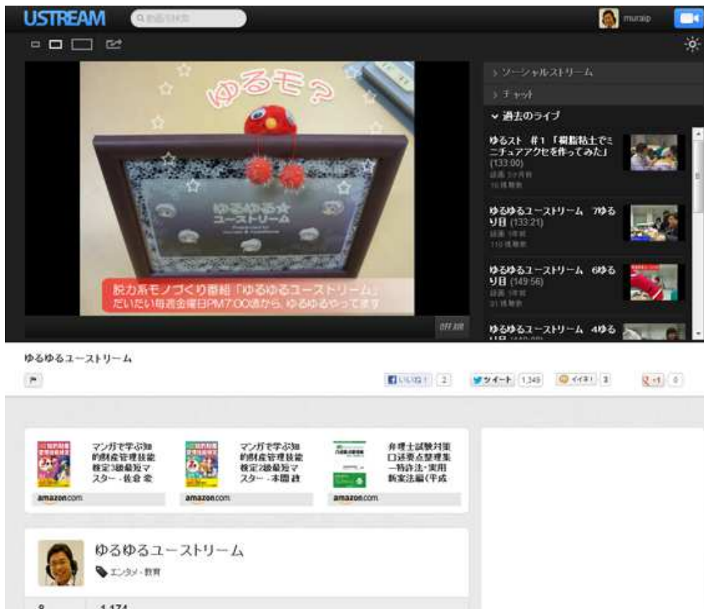
図 3.7 Ustream チャンネル「ゆるゆるユーストリーム」 http://ustre.am/E5xA

収録映像は図 3.6 に示す YouTube 上に登録する。当チャンネルには、クレイアニメを用いた著作権講座「ワン太の著作権講座」が登録されており、再生リスト合計で 1 万回を超えるアクセスがある。リスト登録者もいるので、こちらに登録することである程度の視聴者数を見込むことができる。