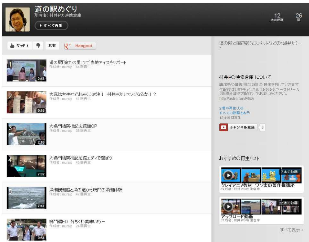
図 3.6 YouTube チャンネル「村井 P の映像倉庫」 http://www.youtube.com/user/muraip の再生リスト

図 3.5 に公開用のブログのトップページを示す。かねてより学生達と不定期配信していたモノ作り番組「ゆるゆるユーストリーム」の公式サイトに追加コンテンツとして「道の駅めぐり」を登録している。舞台裏映像やディレクターズカット、映像制作のコツ等も本ブログにて紹介していく予定である。