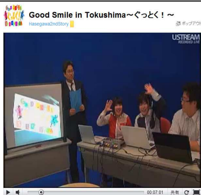
Ustream番組 http://ustre.am/JLiZ Good Smile in Tokushima〜ぐっとく！〜 平成24年4月20日配信

「徳島のスマイルを世界にお届けする」をコンセプトに制作された番組。教員と学生のコラボによる、ゆるーい雰囲気が特徴。