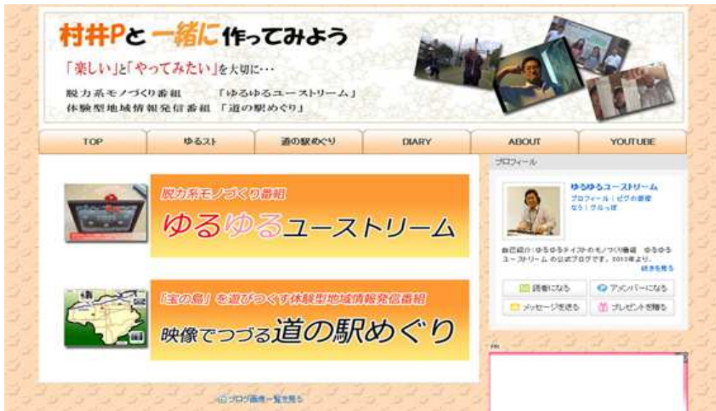
図 3.5 ブログ「村井 P と一緒に作ってみよう」 http://ameblo.jp/muraip2

活動の成果は、ブログ、YouTube、および Ustream 等のネットメディア上に公開していく。ブログは逐次更新型のストックメディアとして適しており、活動の最新報告や映像コンテンツ等へのブックマークとして活用する。